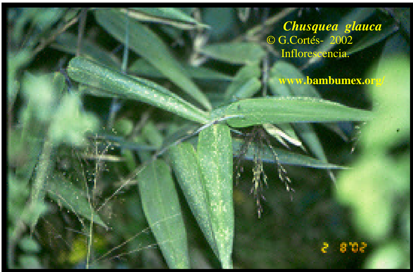
Chusquea glauca Inflorescencia.