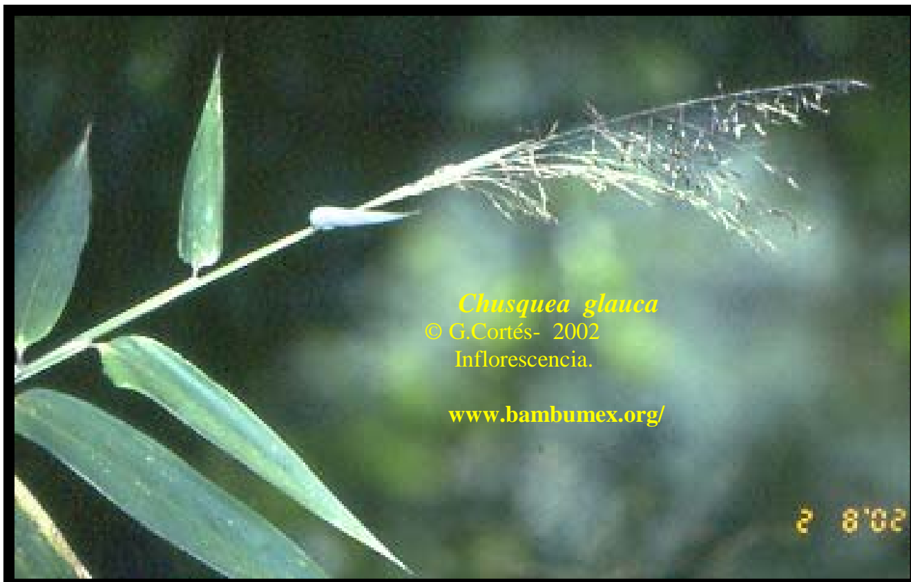
Chusquea glauca Inflorescencia.